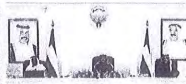
خلال جلسة مجلس الوزراء