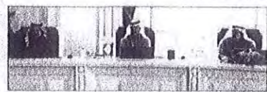
برديوي وزير العدل وحامي وزير العدل

قرر مجلس الوزراء رفع الحد الأقصى لغرامة المخالفات المرورية من 10 آلاف دينار إلى 15 آلاف دينار، وذلك في إطار خطة الحكومة لرفع سقف الغرامات المرورية. ووافق المجلس على رفع الحد الأقصى لغرامة المخالفات المرورية من 10 آلاف دينار إلى 15 آلاف دينار، وذلك في إطار خطة الحكومة لرفع سقف الغرامات المرورية. ووافق المجلس على رفع الحد الأقصى لغرامة المخالفات المرورية من 10 آلاف دينار إلى 15 آلاف دينار، وذلك في إطار خطة الحكومة لرفع سقف الغرامات المرورية.