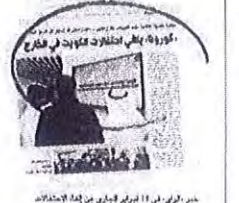
تدابير أمنية في إطار مكافحة كورونا

تدابير أمنية في إطار مكافحة كورونا، وذلك في إطار خطة الحكومة لرفع سقف الغرامات المرورية. وافق المجلس على رفع الحد الأقصى لغرامة المخالفات المرورية من 10 آلاف دينار إلى 15 آلاف دينار، وذلك في إطار خطة الحكومة لرفع سقف الغرامات المرورية.